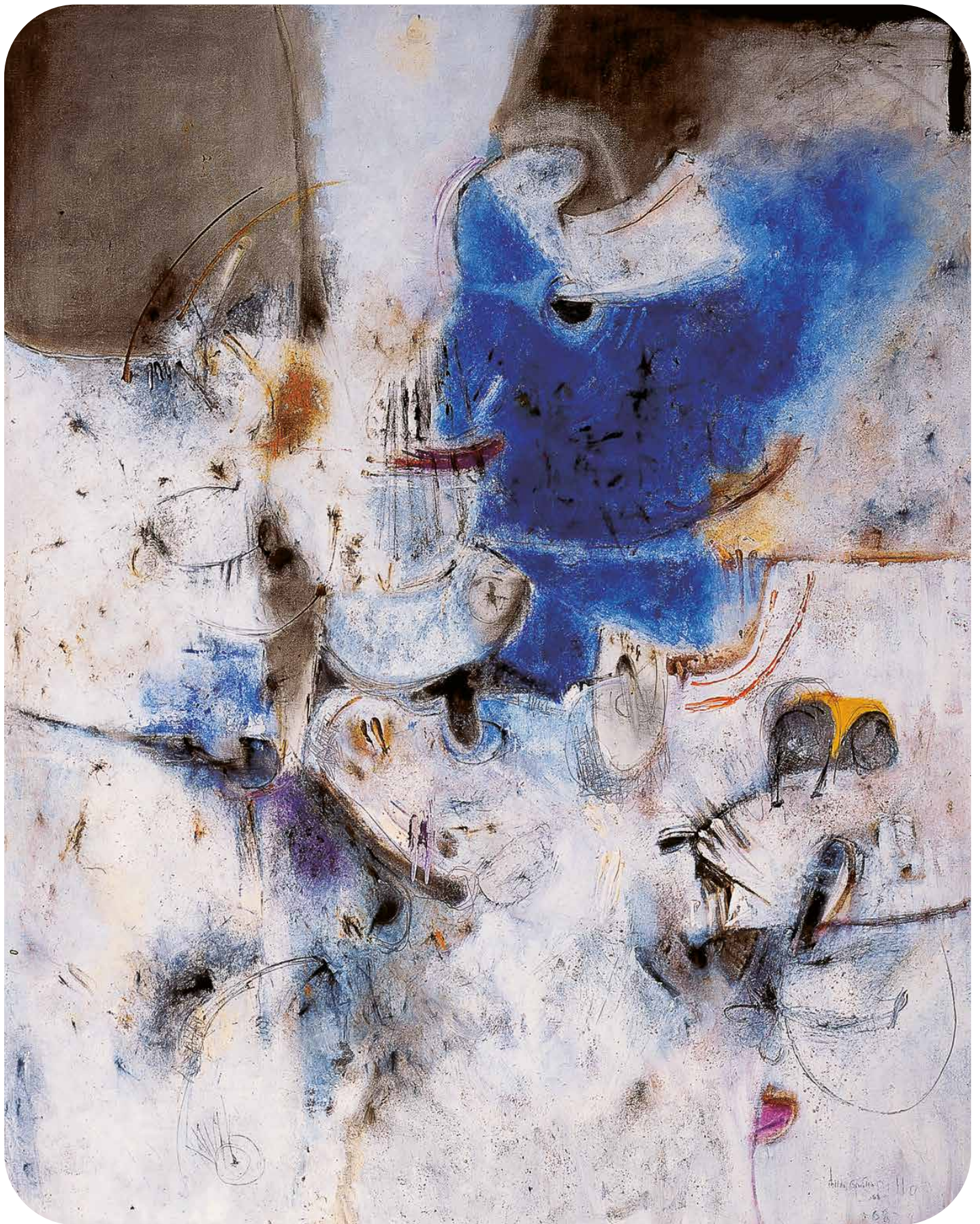
Lilia Carrillo, Amor floreciente , 1968. Óleo sobre tela.