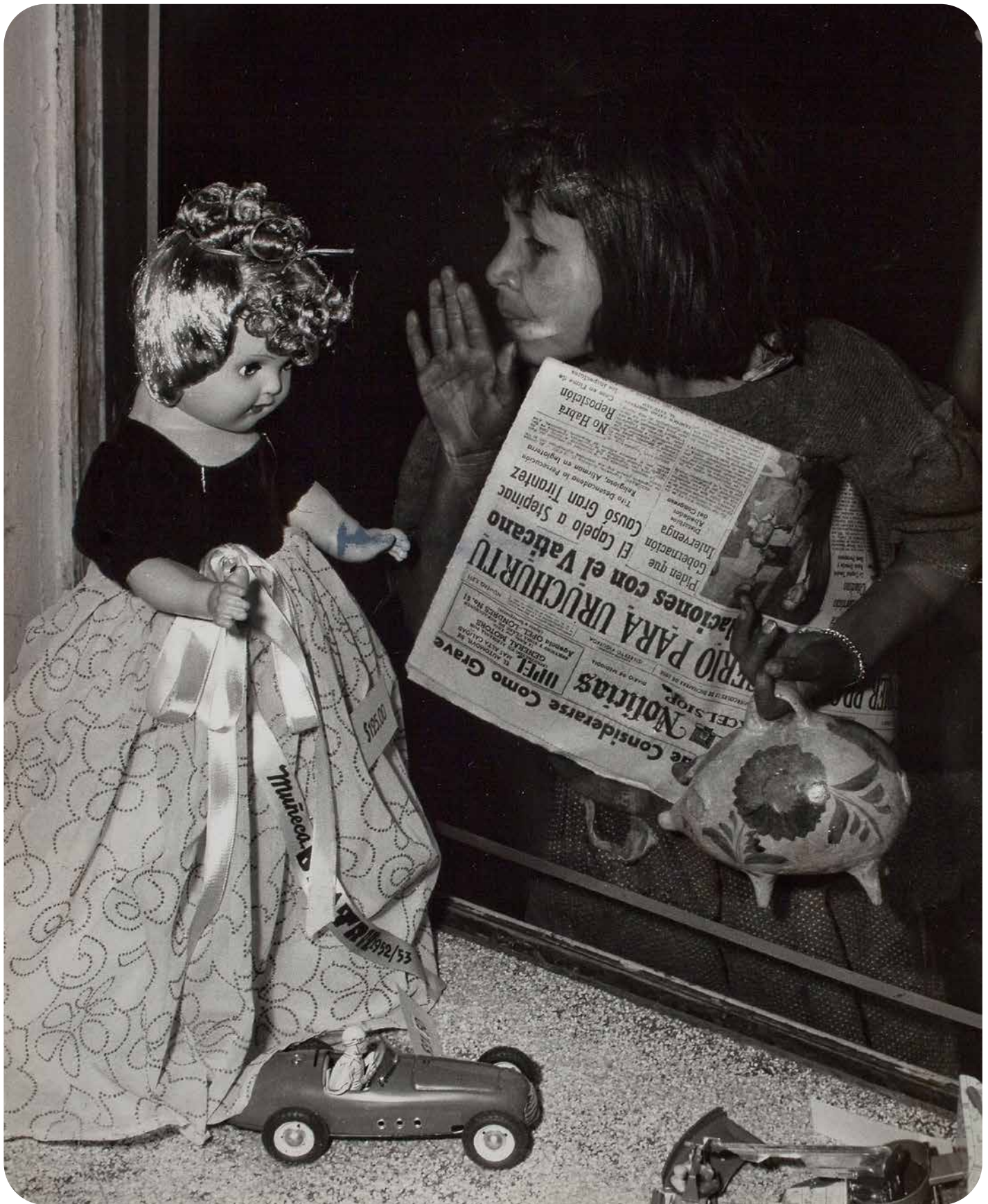
Héctor García, Sin título ( muñecas ), 1952. Plata sobre gelatina.