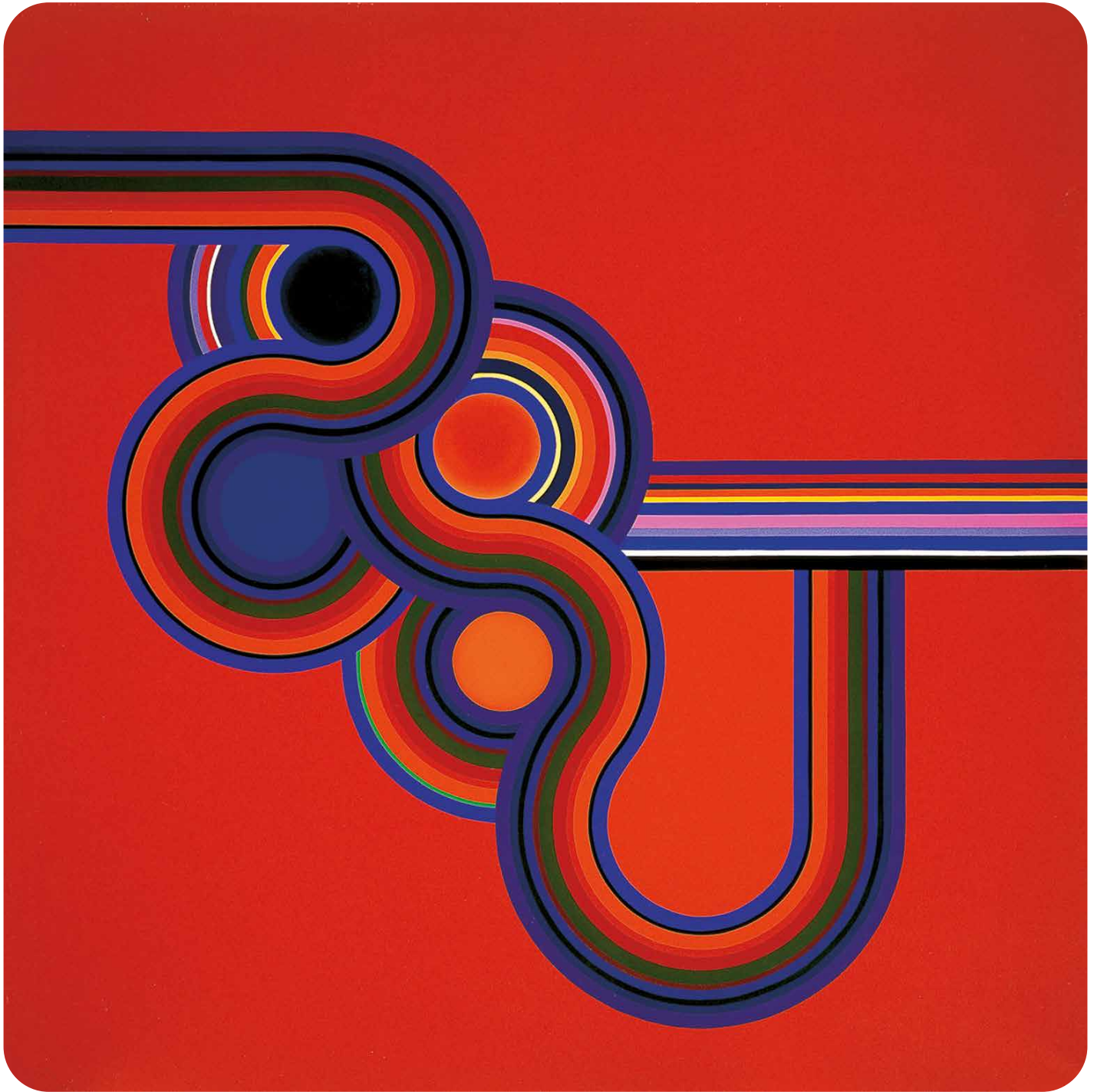
Kazuya Sakai, Come out (Steve Reich) , 1976. Acrílico sobre tela.