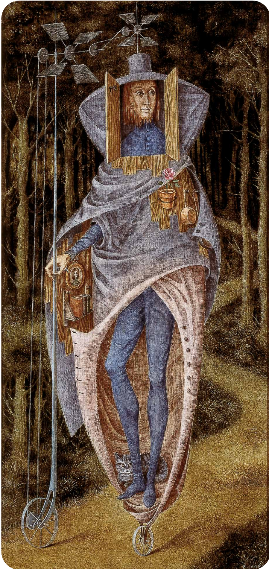
Remedios Varo, Vagabundo , 1957. Óleo sobre masonite.