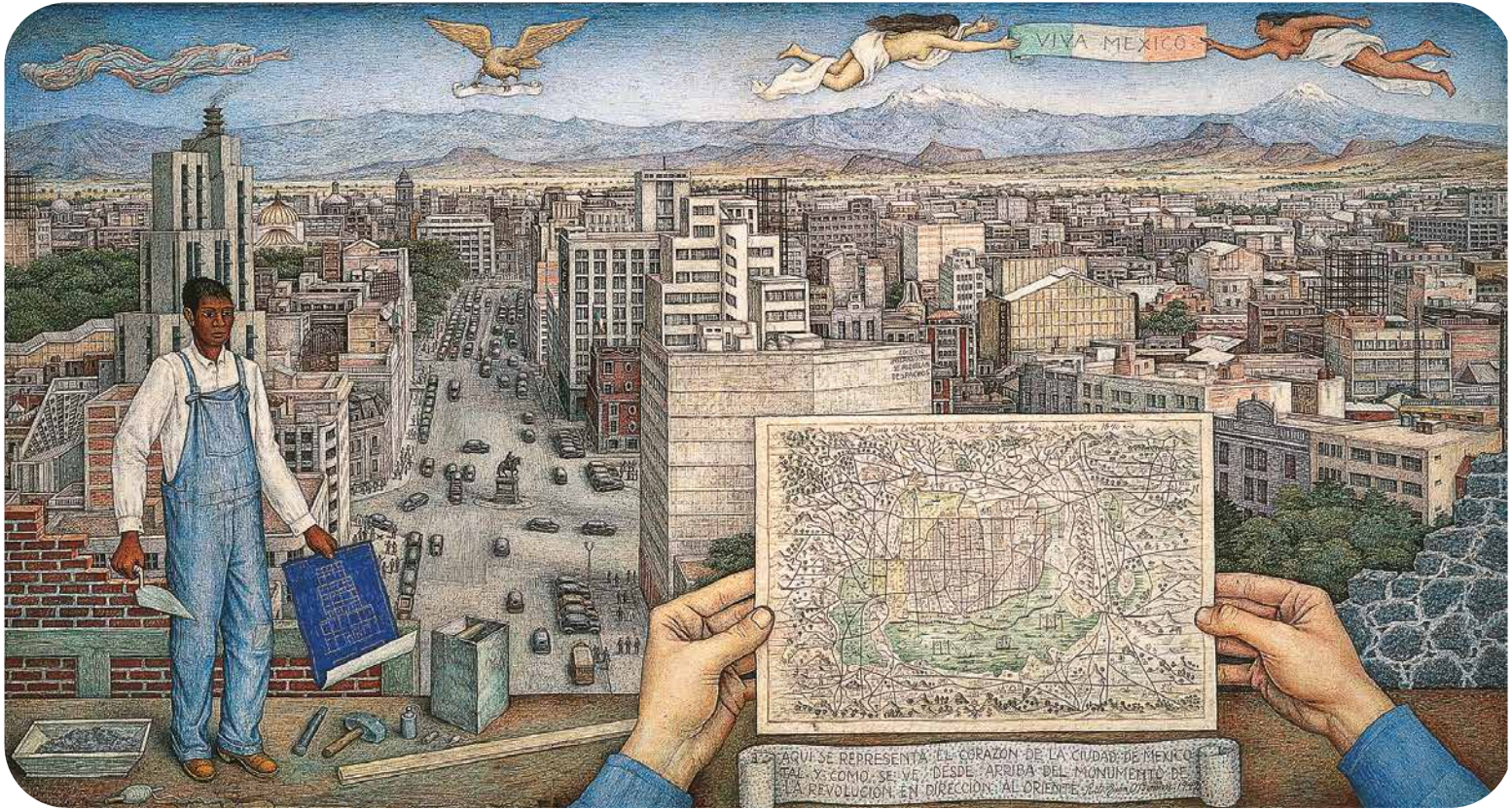
Juan O' Gorman, La Ciudad de México , 1949. Temple sobre masonite.