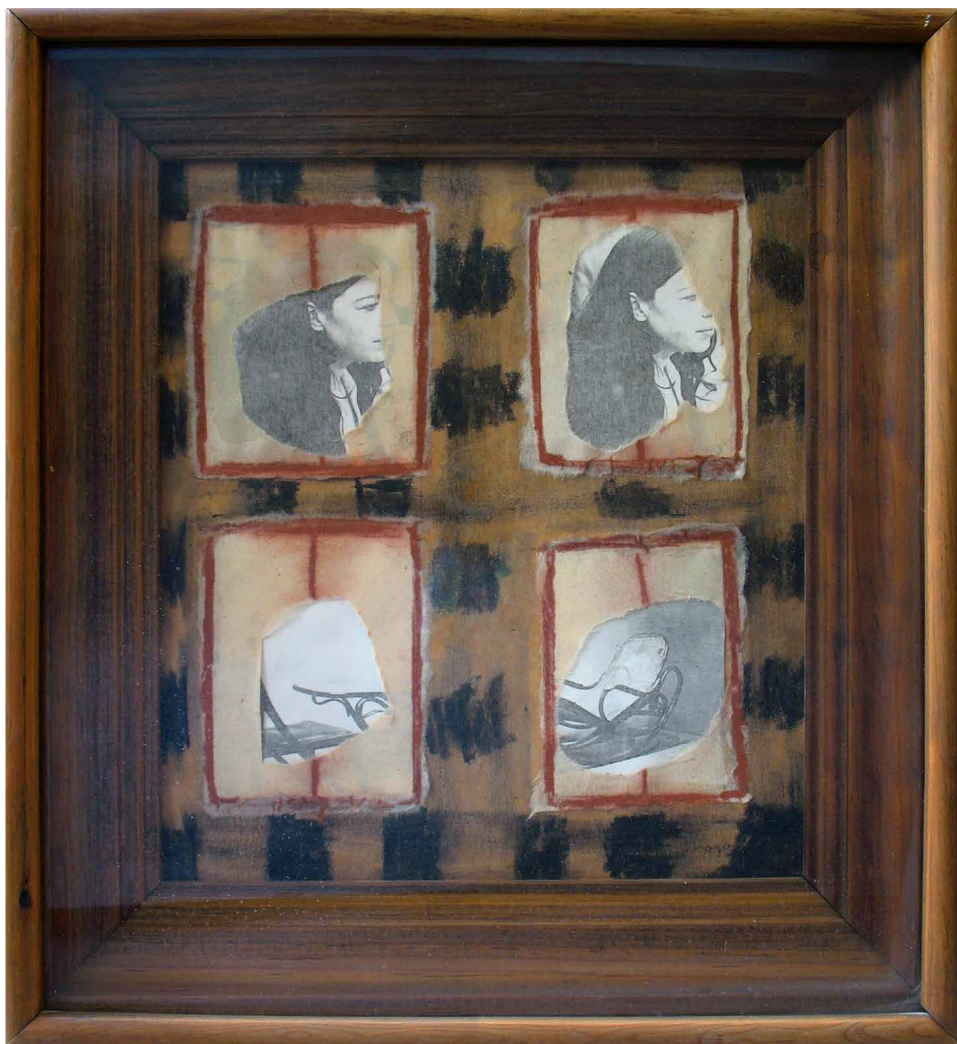
Magali Lara. Ventanas (Windows) , 1977. Collage.