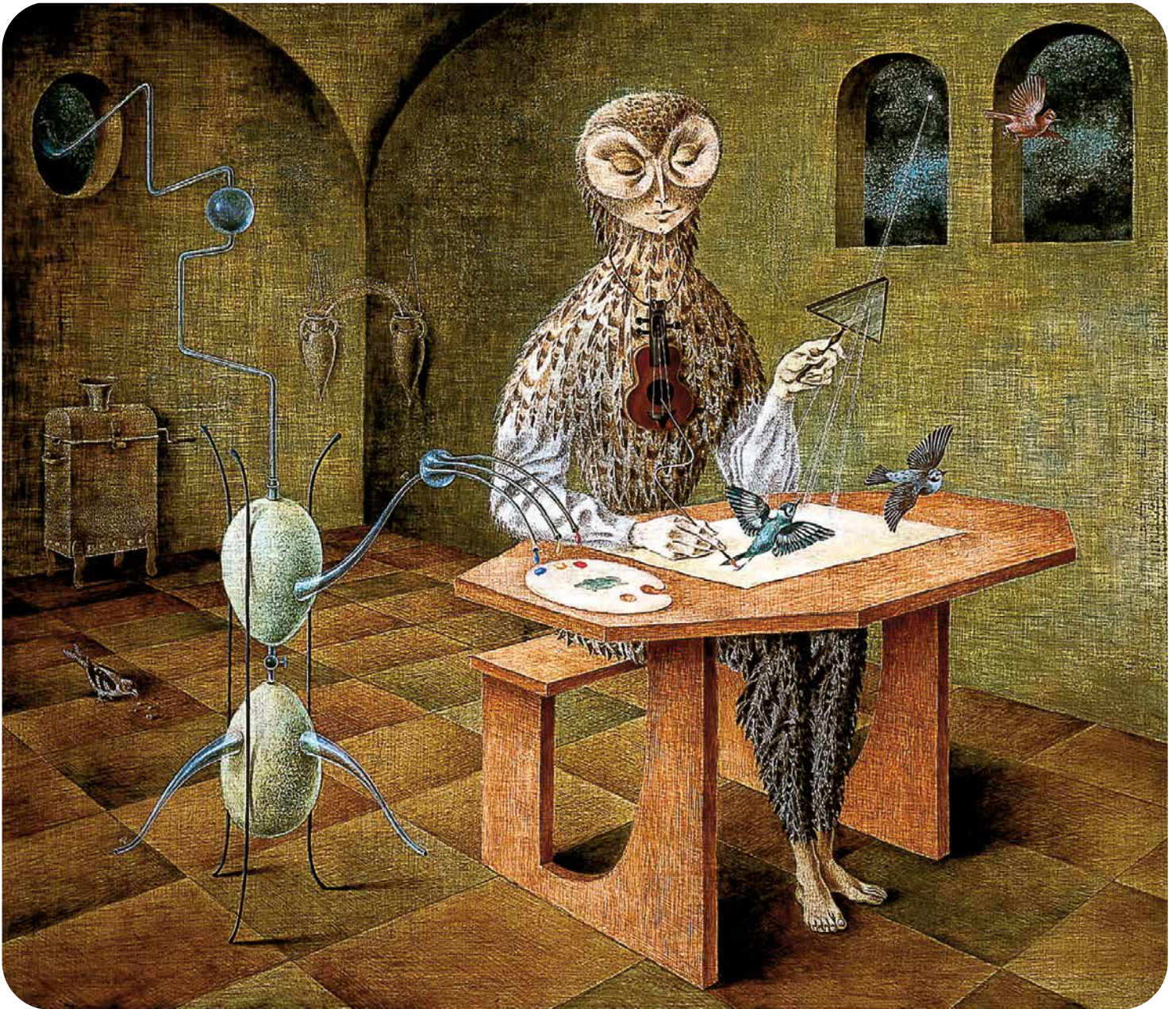
Remedios Varo, La creación de las aves , 1957. Óleo sobre masonite.