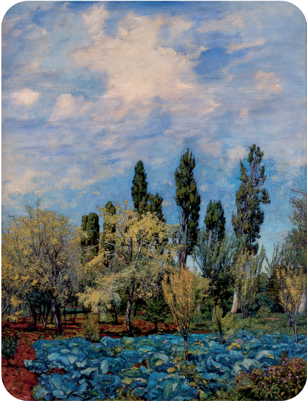
Francisco Goitia, Huerta del ex-convento de Guadalupe, Zacatecas , 1940. Óleo sobre tela.