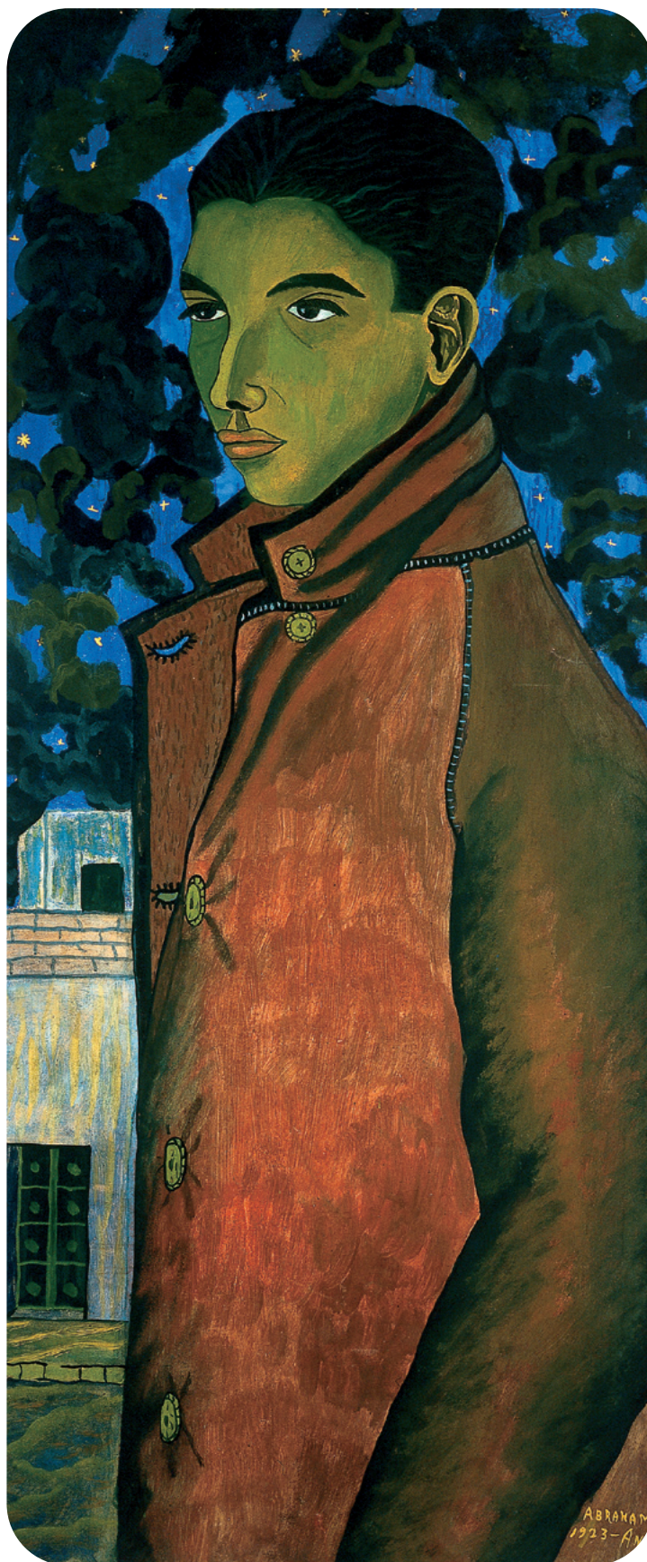
Abraham Ángel, El cadete , 1923. Óleo sobre cartón.