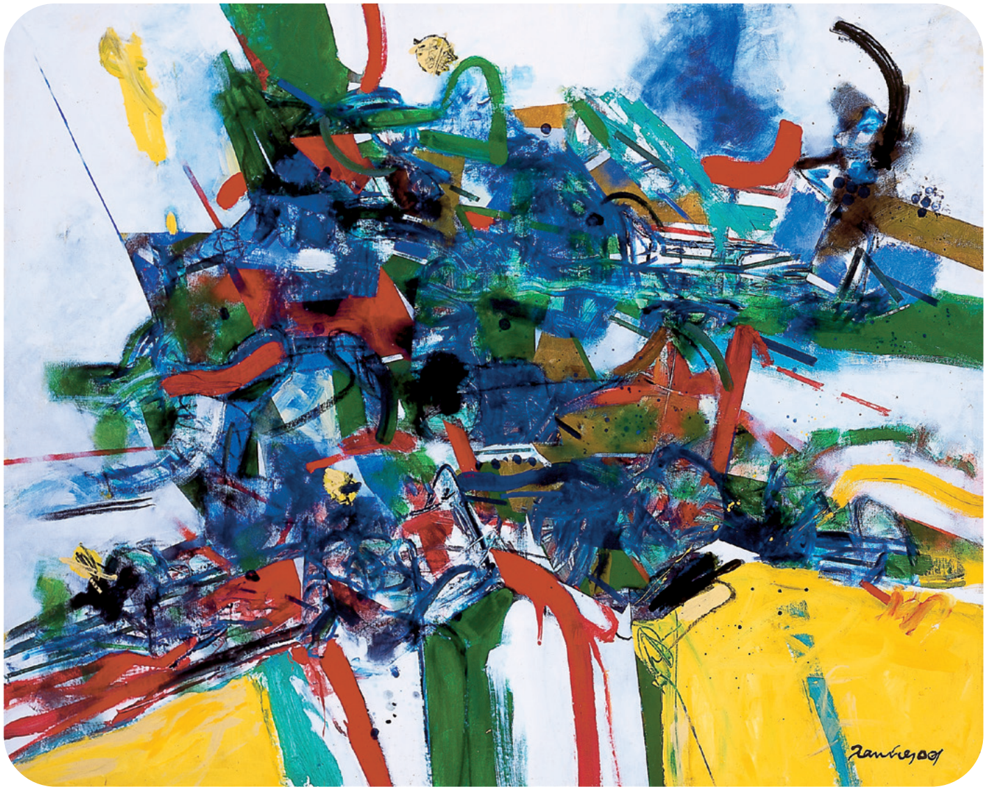
Gabriel Ramírez, Viaje al mediodía I , 2001. Acrílico sobre tela.