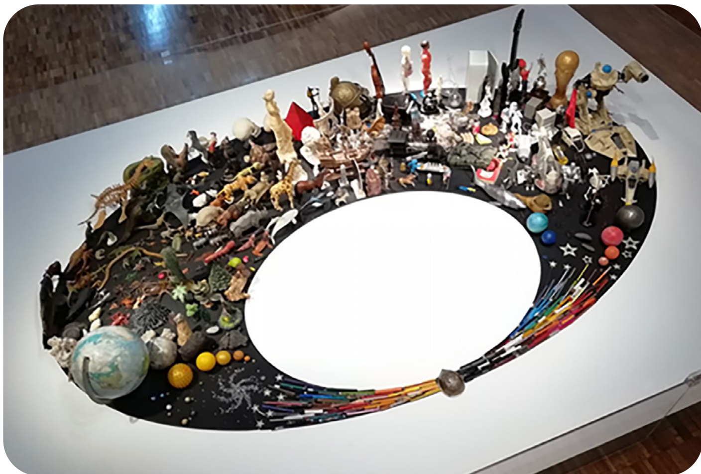
Ulises Figueroa, La historia del universo , 2011. Múltiples objetos colocados sobre placa de MDF.