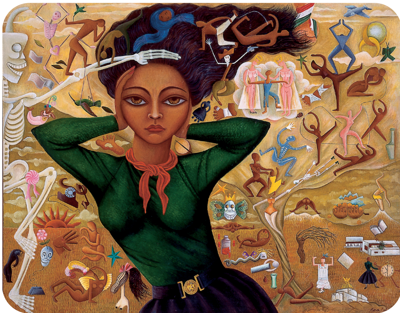
Rosa Rolanda, Autorretrato , 1952. Óleo sobre tela.