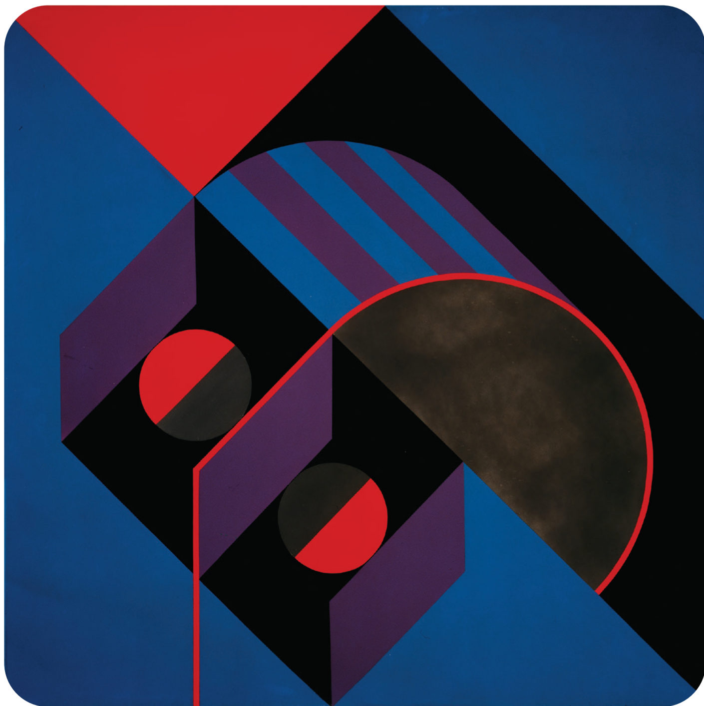
Manuel Felguérez, Lógica de la indiferencia incierta , 1973. Laca sobre tela.