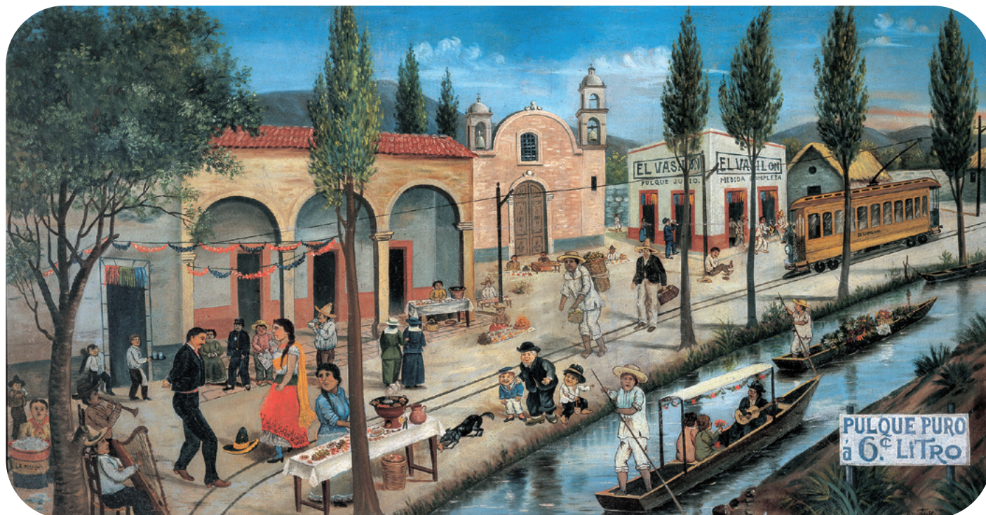
Jesús E. Cabrera, Pulquería El Vacilón , 1919. Óleo sobre tela.