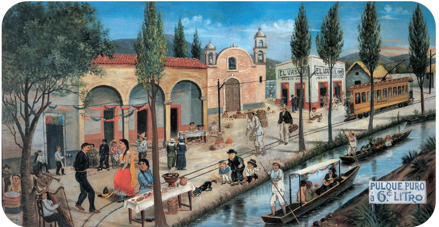
Jesús E. Cabrera, Pulquería El Vacilón , 1919. Óleo sobre tela.