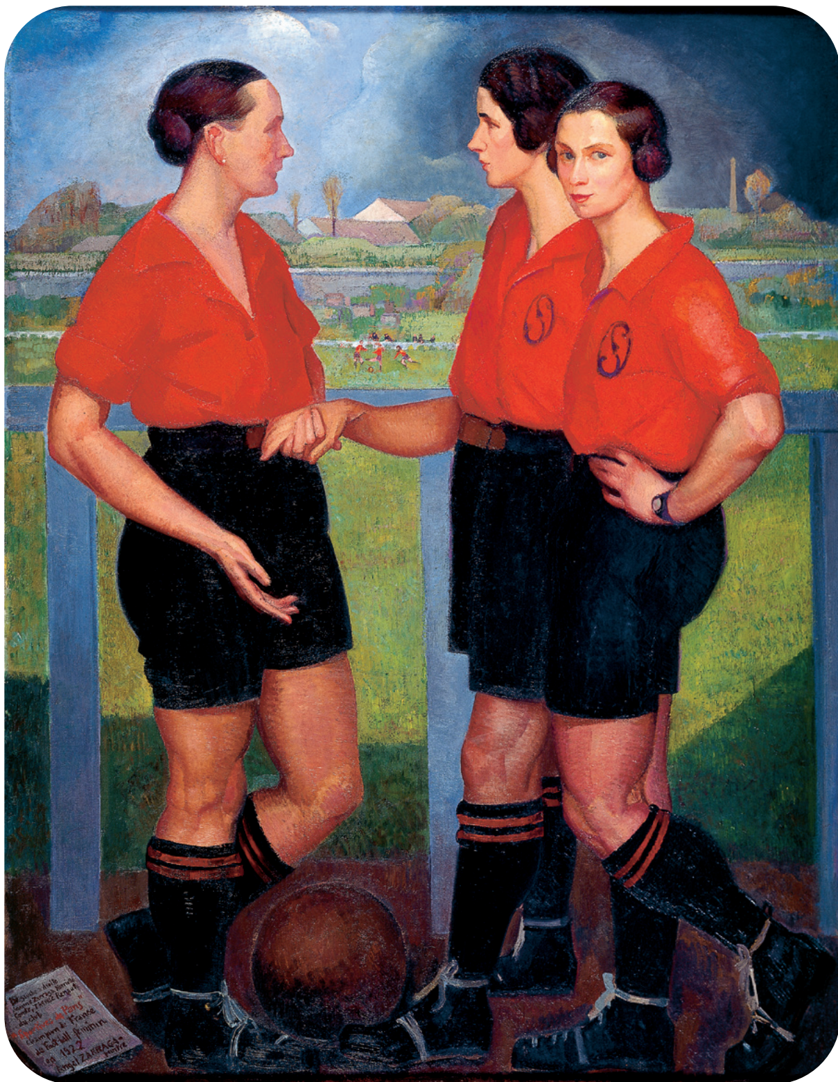
Ángel Zárraga, Las futbolistas , 1922. Óleo sobre tela.