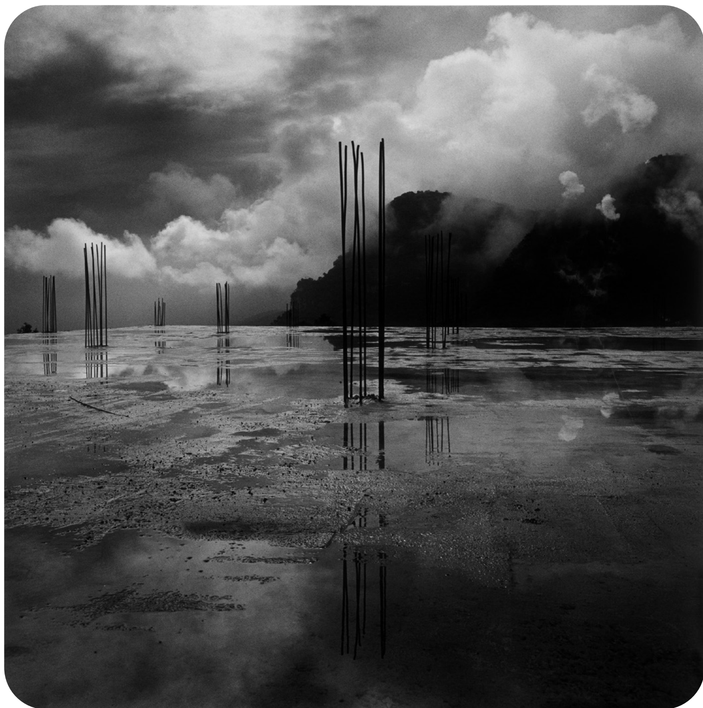
Graciela Iturbide, Construcción , Chalma, México, 2008. Plata sobre gelatina.