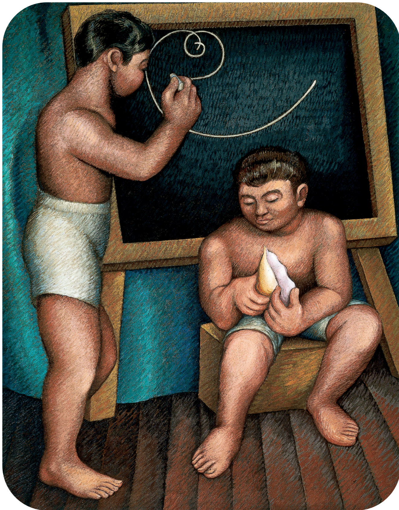
Agustín Lazo, En la escuela , 1943. Óleo sobre tela.