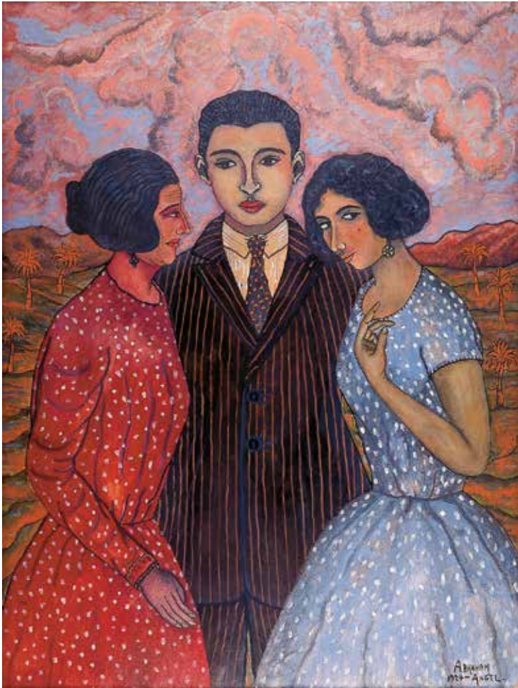
Abraham Ángel La familia , 1924 Óleo sobre cartón

Observa la pintura y responde a las preguntas: