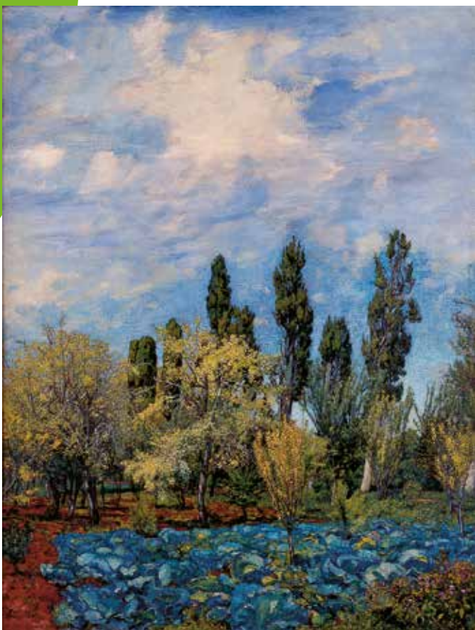
Francisco Goitia. Huerta del ex-convento de Guadalupe, Zacatecas, ca. 1940 Óleo sobre tela