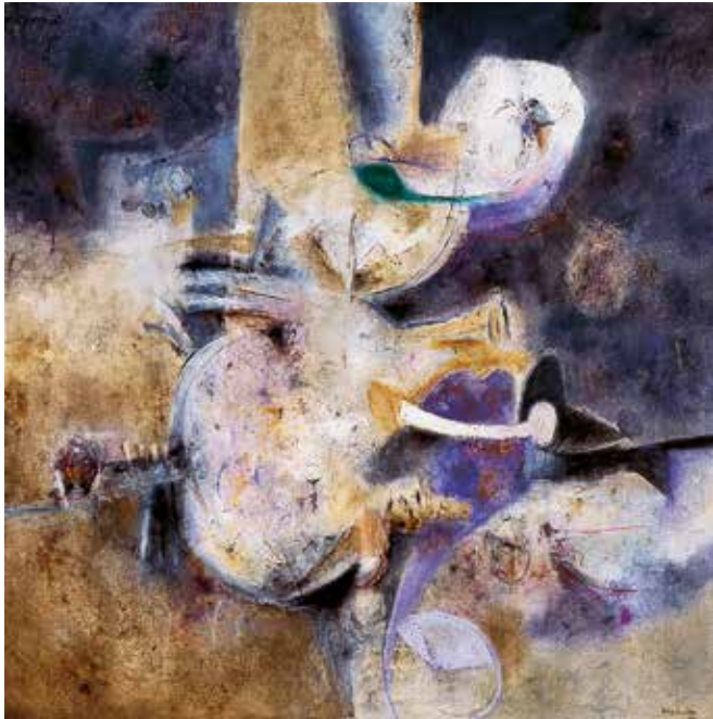
Lilia Carrillo Introspección , 1966 Óleo sobre tela

Cuando observamos una representación, ya sea en pintura o escultura, con base en líneas y formas de estructuras geométricas básicas o complejas, nos referimos al arte abstracto.